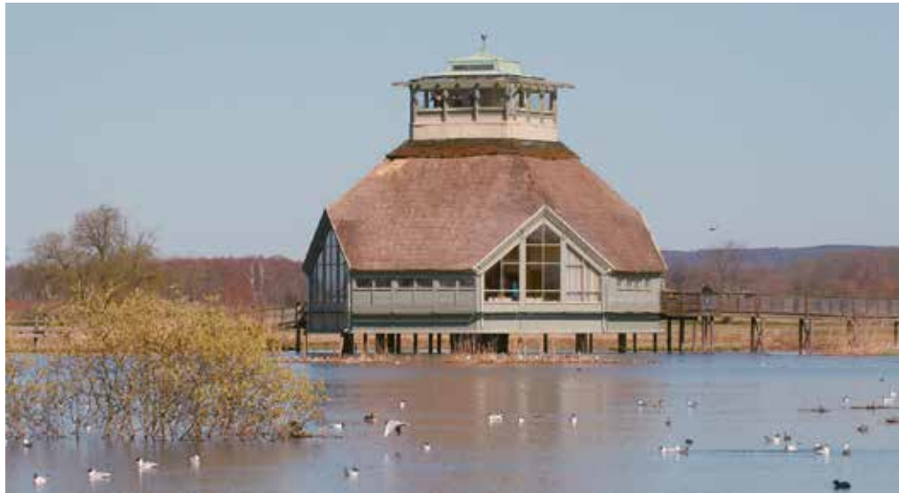
Hornborgasjön i Sverige er et yndet turmål også for norske ornitologer. Her Horborga Naturum.

18:30: Lokallagsmøte for NOF Fredrikstad lokallag, i klubbhuset på Øra.