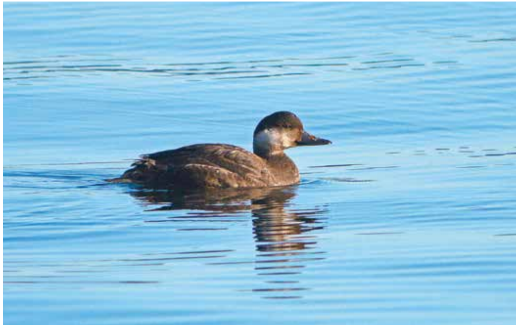
Dykkender står i fokus når NOF Trondheim lokallag tar turen til Malvik 2. april. Svartand (bildet) og andre dykkender opptrer i betydelige antall i Trondheimsfjorden om våren.

Ekskursjon NOF Trondheim lokallag: Dagstur til Innherred. Vi kjører en runde og besøker lokaliteter i Nord-Trøndelag. Blant annet vil vi besøke Hammervatnet, Ørin og Leksdalsvatnet, men vi stopper også på andre steder der det vanligvis er