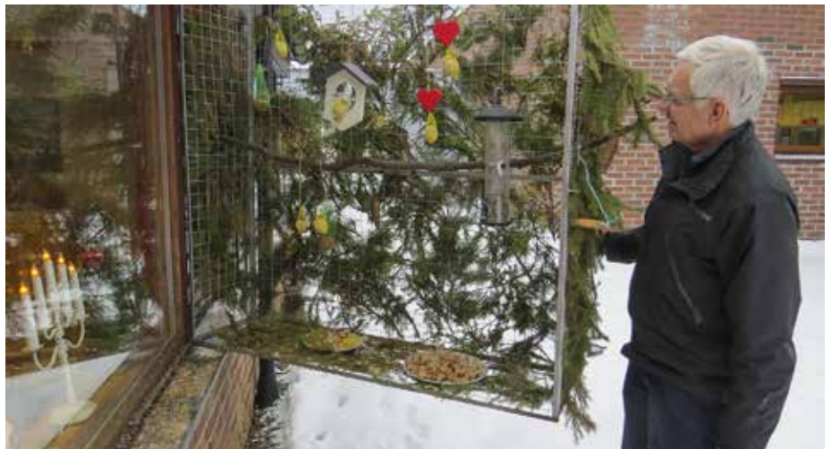
Brød og annen mat som ikke blir brukt på omsorgssenteret kapper brukerne opp selv og setter ut til fuglene på skåler i bunnen av karnappet.