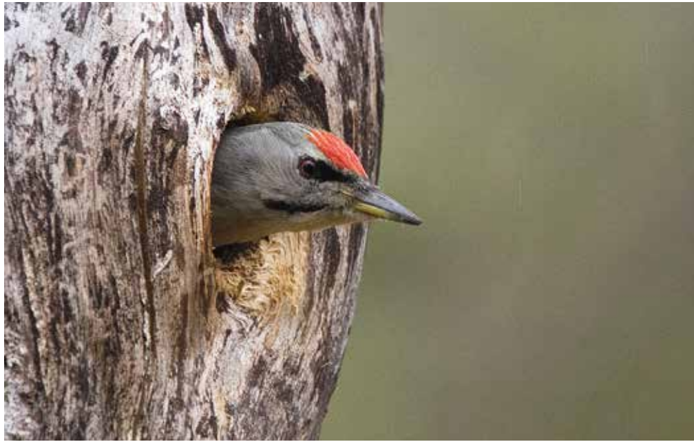
For mange ornitologer er det å lete etter spettefugler et høydepunkt om våren. Bildet viser en gråspett hann.

10-13: Ekskursjon NOF avd. Aust-Agder: Vi håper på fint vær og tar turen til Havsøy for å se på fugler. Møt opp på brygga ved