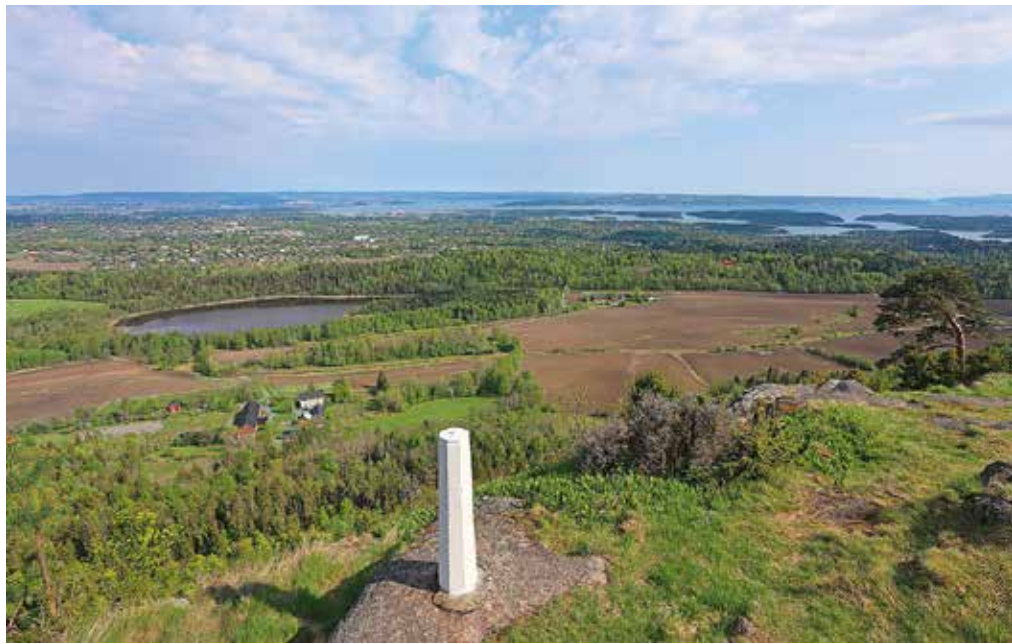
Utsikt fra Kolsåstoppen mot Dælivann og Oslofjorden. I mai har NOF OA fire onsdagsturer til Dælivann, samt en tur fra Dælivann til Kolsåstoppen.

NOF Hamar lokallag møtes hver torsdag kl. 18:00 (utemøter) i perioden 12. april til 31. mai. Frammøte langs veien ved flomdammen på Starene i april, og ved Espern i mai (ett eller flere av møtene i mai vil bli viet ringmerking av kattugle, eventuelt andre ugler). NB! Helligdagene 10. og 17. mai blir erstattet av 9. og 16. mai. Torsdag 24. mai møtes vi ved Torp kafé (tidl. Torps lege-senter) og ser etter fugl langs Mjøsstranda.