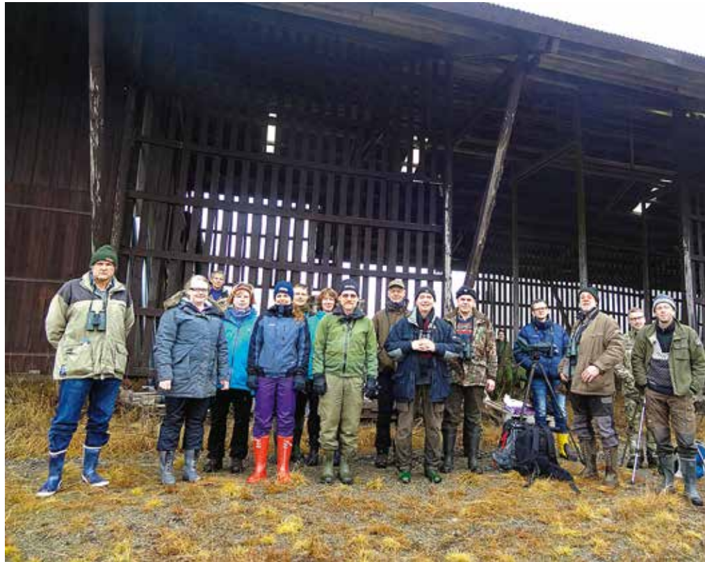
Fra fjorårets tur til Flakstadmåsan. De første tranene kommer på denne tida, og orrfuglen spiller på måsan.

18-20:30: Ekskursjon NOF OA: Maionsdag til Dælivann. Se 2. mai for detaljer. Turleder: Per Stensland (95 14 74 99).