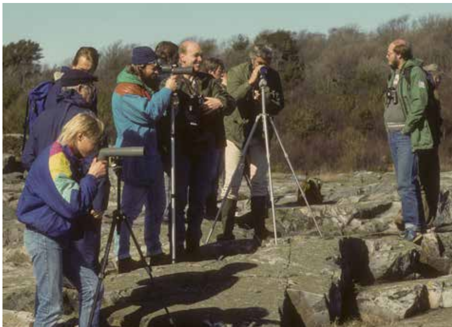
For tretti år siden dro fuglefolket på årsmøteutflukt til Jomfruland den 24. april 1988. Nå samles vi på ny på denne spennende fugleøya i havgapet.

Norsk Ornitologisk Forening avholder sitt årsmøte på Thon Høyer hotell i Skien helga 13.-15. april. Arrangementet foregår i samarbeid med NOF avd. Telemark, som for øvrig fyller 50 år i år. Selve årsmøtet er lørdag 14. april kl. 09.30 - 11.30. Det hele starter fredag kveld og vil foruten årsmøte inneholde organisatoriske møter, faglige foredrag, turopplegg, utdeling av priser, festmiddag og sosiale forekomster, og rundes av med tur til Jomfruland fuglestadion på søndag. Alle medlemmer er velkomne til en begivenhetsrik helg sammen med andre fuglefolk. Påmeldingsskjema er lagt ut på www.birdlife.no . Det er også mulig å melde seg på ved å ringe til sekretariatet.