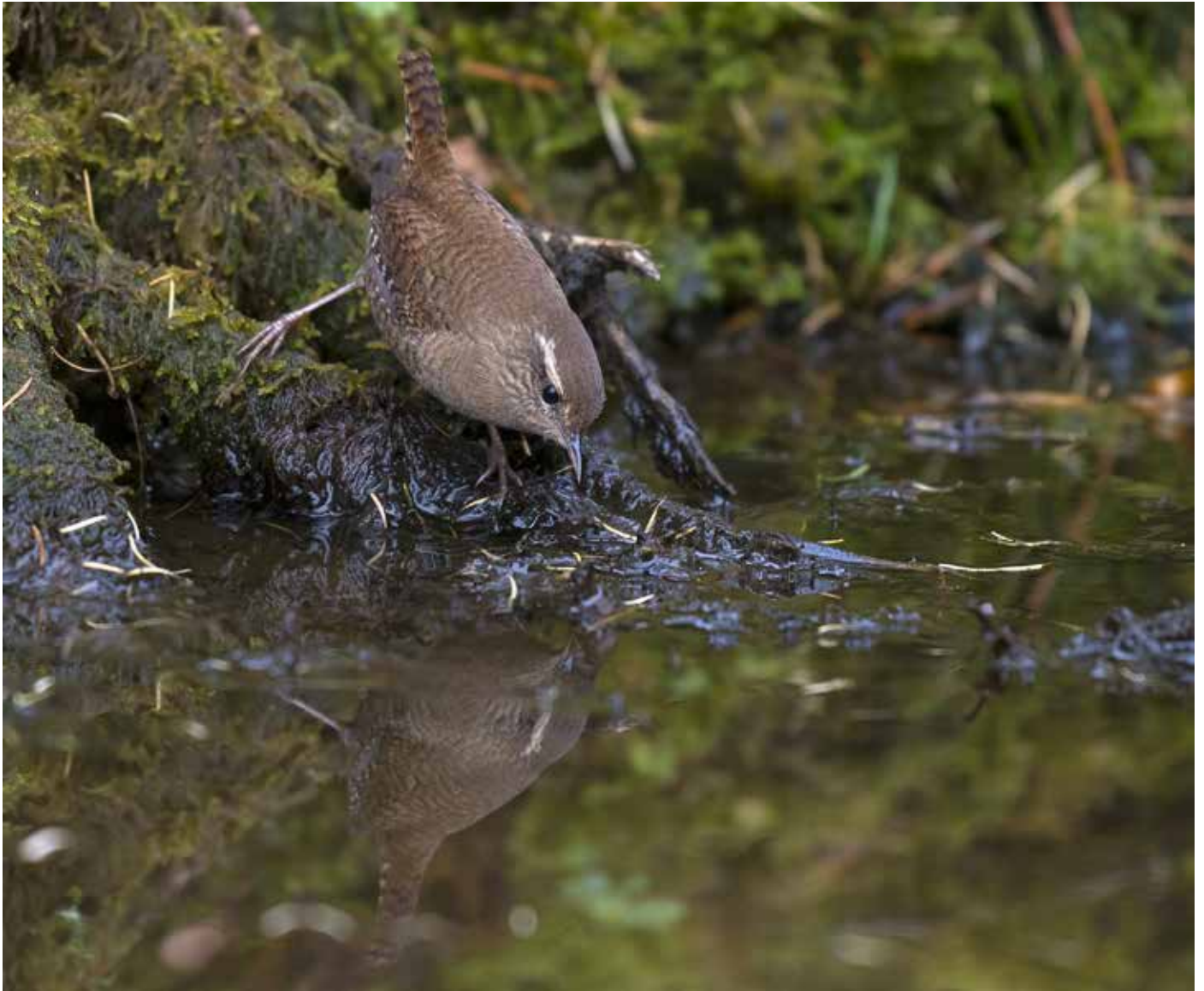
Både gjerdesmetten (over) og notteskrika speiler seg i vannflaten når de kommer ned for å drikke. Notteskrika tar seg gjerne et bad også (bildet under).